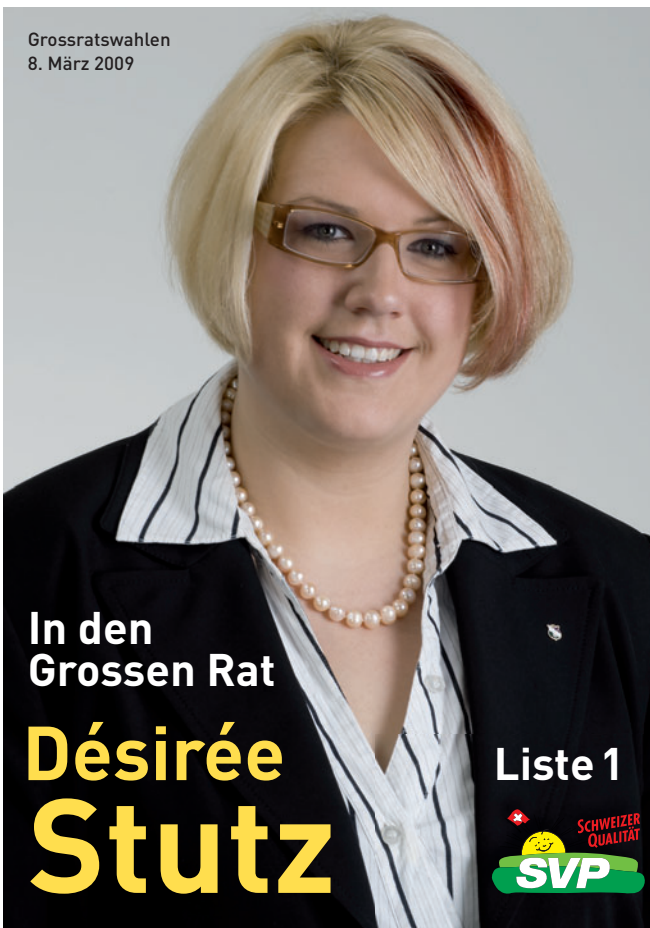
Plakat / Poster